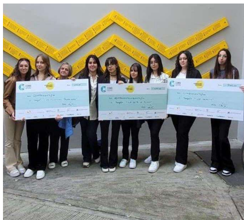
Classi IV e V Moda

A Como la premiazione del concorso che ha visto in gara 30 Istituti